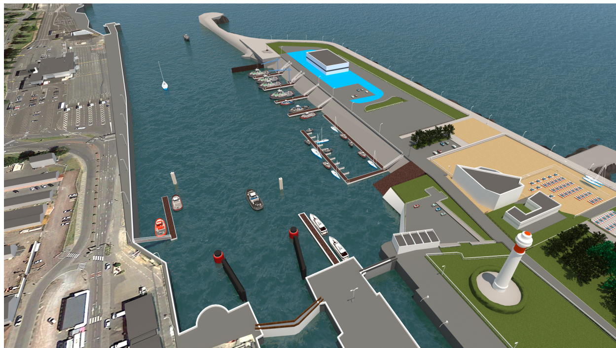
Vue 3D du réaménagement de l'avant-port de Ouistreham en lien avec la réalisation de la base de maintenance du champ éolien de Courseulles sur mer