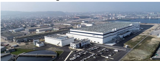
L'usine LM Wind Power / GE Renewable située sur le port de Cherbourg, à proximité immédiate des quais