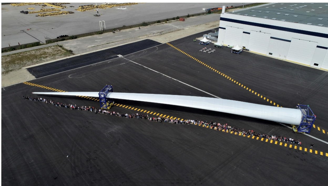
La plus grande pale du monde (107m) est construite à Cherbourg par GE / LM Wind Power