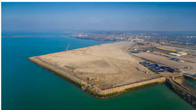
En gagnant 39ha sur la mer, Ports de Normandie dispose désormais à Cherbourg de 100 ha dédiés aux EMR, bordés par un quai lourd (15T/m 2 ) de 320m de long

De même, sur le volet environnemental et paysager , Ports de Normandie souhaite que la localisation du parc rende possible la mutualisation des raccordements à terre comme en mer , à travers la création de « hubs électriques ». Ceux-ci seront rendus possibles par une vision de long terme de la programmation des Energies Marines Renouvelables, par la standardisation des connexions, et enfin par l'anticipation de la capacité d'augmentation de la puissance de raccordement.