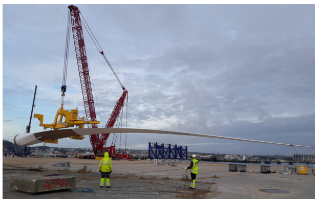
Essai de transfert de la plus grande pale du monde, l'Haliade X (107m), sur le quai lourd (15T/m 2 ) du port de Cherbourg

Ports de Normandie souhaite donc que le choix de localisation du futur parc prenne en considération le besoin en infrastructure portuaire, et revendique que ce choix favorise les projets qui ne multiplient pas les besoins en nouvelles infrastructures, ou à tout le moins ceux qui minimisent le besoin en fonds publics.