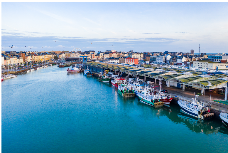
La pêche, une activité identitaire de la Normandie, présente dans les 3 sites de Ports de Normandie.

Par ailleurs, Ports de Normandie considère que le débouché naturel et ultime de la filière EMR est constitué par la transformation de l'énergie « bleue » en hydrogène. Le port de Cherbourg, qui accueillera prochainement une station routière hydrogène reste très ouvert sur la possibilité d'utiliser ses terre-pleins comme lieu de transformation et de distribution de l'énergie produite en mer en hydrogène, afin de fournir au secteur maritime et notamment de la pêche un carburant d'avenir, propre et économique.